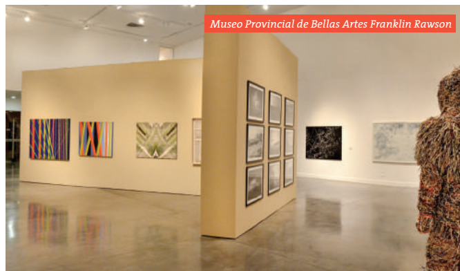
Museo Provincial de Bellas Artes Franklin Rawson