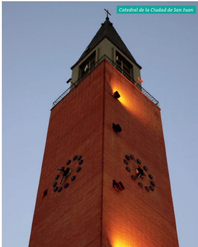
Catedral de la Ciudad de San Juan