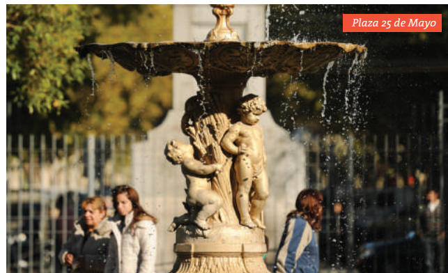
Plaza 25 de Mayo

Dirección y tel.: Laprida 57 Oeste | (0264) 4221573