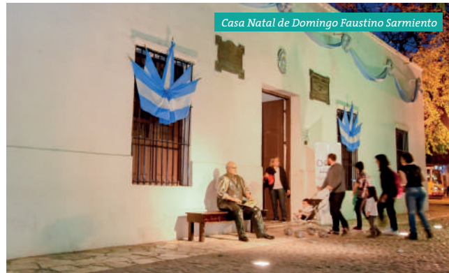
Casa Natal de Domingo Faustino Sarmiento

Dirección y tel.: Sarmiento 21 Sur | (0264) 422 4603