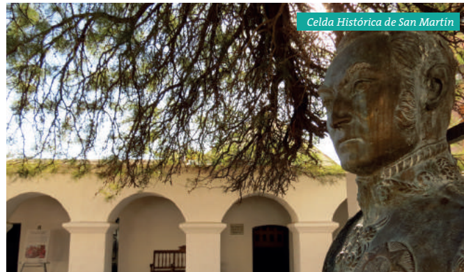
Celda Histórica de San Martín