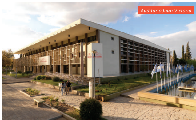
Auditorio Juan Victoria