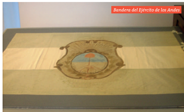
Bandera del Ejército de los Andes

Dirección y tel.: Mendoza 204 Sur | (0264) 422 7050